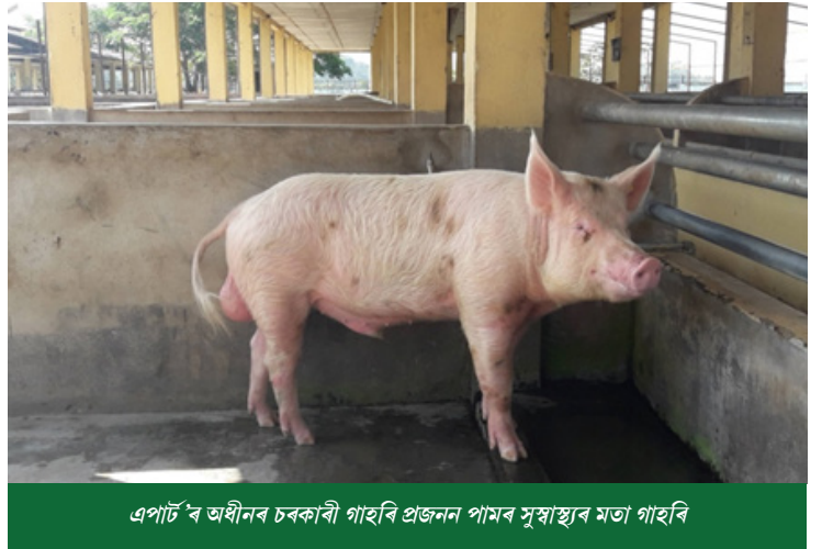
এপাৰ্ট'ৰ অধীনৰ চৰকাৰী গাহৰি প্ৰজনন পামৰ সুস্বাস্থ্যৰ মতা গাহৰি