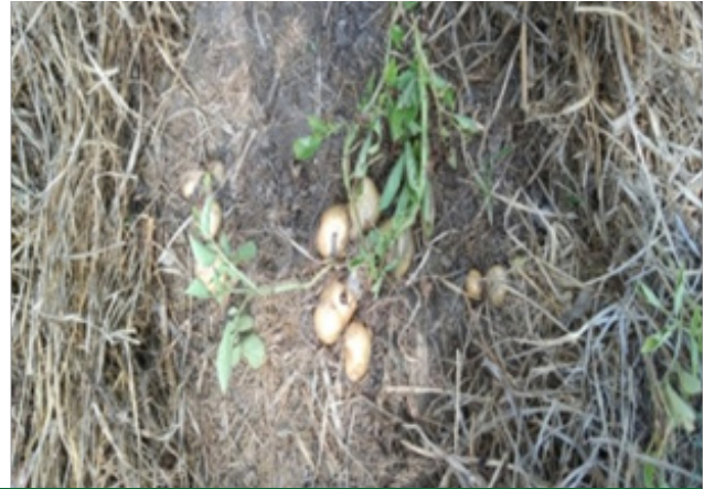
Korpi-tipi SHG of Chapong cultivating Zero tillage Potato production under Langsomepi Development Block

The SHG members were quite enthusiastic about the technology and observing their success many other SHGs have come up seeking information on available training programmes.