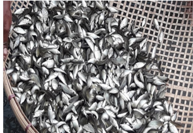
Quality fish seed from NFFBB, Odisha