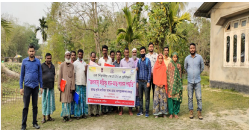
Group discussion on Better Management Practices (BMP) for paddy cum fish integrated farming