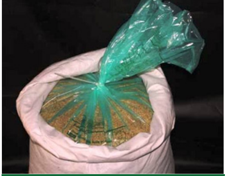
বেগটোৰ সামৰ্থ অনুযায়ী শস্য বা বীজ ভৰোৱা উচিত