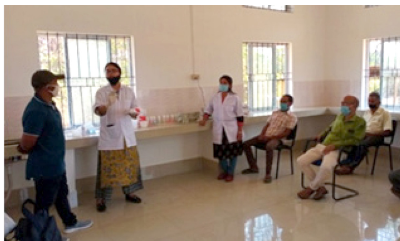
Training of DDD officers and staff at Manja laboratory