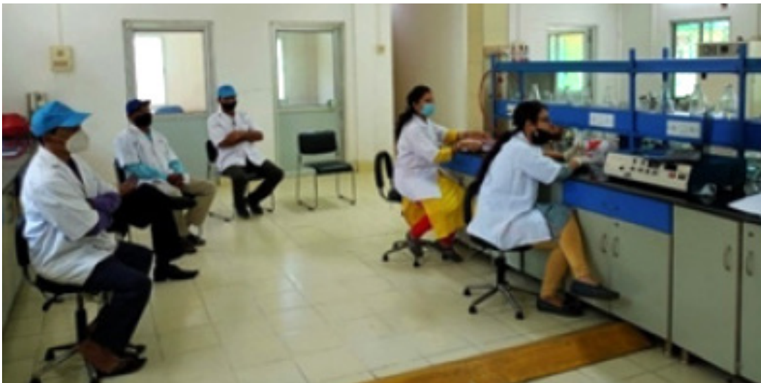
Training of DDD officers and staff at Khanapara laboratory