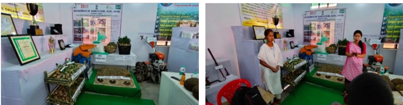
District Agricultural Department stall at Karbi Youth Festival held (Taralangso, Diphu) on 15th -19th February '2021

Contributed By: Rasinja Englengpi (DHC, APART), Parkha Jigdung (DSSC, APART)