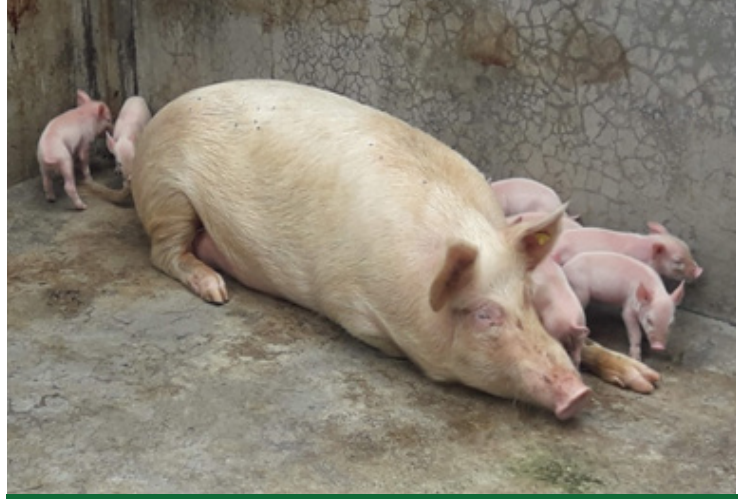
এপাৰ্টৰ অধীনৰ গাহৰি প্ৰজনন পামত — সুস্থ অৱস্থাত থকা মাক আৰু পোৱালী

বিংশতম পশুধন পিয়লৰ তথ্য মতে, অসমত ২০.১০ লাখ গাহৰি আছে। গাহৰি পালনৰ ক্ষেত্ৰত এতিয়া আগৰ দৰে কোনো সামাজিক বাধা নোহোৱাৰ ফলত নিবনুৱা যুৱক সকলৰ মাজত স্বাৱলম্বী হ'বলৈ এটা লাভজনক উদ্যোগ হিচাপে পৰিগণিত হৈছে। 'আফ্ৰিকান ছোৱাইন ফিভাৰ' (ASF) অসমত যোৱা বছৰৰ (২০২০) ফেব্ৰুৱাৰীৰ পৰা মাৰ্চ মাহৰ ভিতৰত প্ৰত্যক্ষ কৰা হৈছিল আৰু ই এবিধ গাহৰিৰ অতি মাৰাত্মক ৰোগ। এই ৰোগটো অসমত ১০০ বছৰৰ পিছত প্ৰাদুৰ্ভাৱ ঘটিছে। এই মাৰাত্মক ৰোগ বিধ আফ্ৰিকান ছোৱাইন ফিভাৰ (ASF) ভাইৰাছৰ দ্বাৰা সংক্ৰমিত হয়। ASF ৰোগ ক্লাছিকেল ছোৱাইন ফিভাৰ আৰু ছোৱাইন ফ্লু-তকৈ সম্পূৰ্ণ পৃথক। ASF মানুহলৈ কোনো কাৰণতে সংক্ৰমিত নহয় কিন্তু মানুহৰ জোতা, চেণ্ডেল, কাপোৰ আদিত লাগি থাকি বেমাৰী গাহৰিৰ পৰা সুস্থ গাহৰিলৈ বিয়পিব পাৰে। ক্লাছিকেল ছোৱাইন ফিভাৰ (CSF)ৰ যেনেকৈ প্ৰতিষেধক ছিটা উপলব্ধ আছে কিন্তু আফ্ৰিকান ছোৱাইন ফিভাৰ (ASF)ৰ কোনো প্ৰতিষেধক এতিয়ালৈকে আৱিষ্কাৰ হোৱা নাই। গতিকে