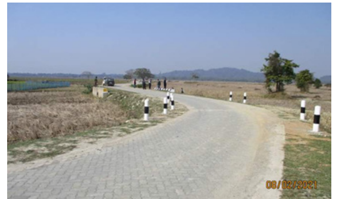
এপাৰ্ট' প্ৰকল্পৰ অধীনত নিৰ্মাণ হোৱা বিভিন্ন পথৰ দৃশ্য