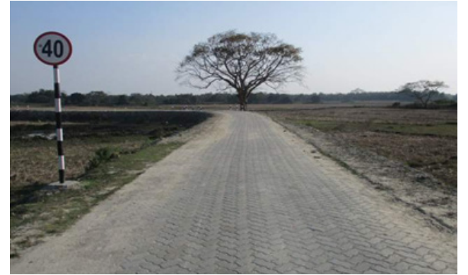
বিশ্ববেংকৰ অৰ্থ সাহায্যৰে ৰূপায়ণ কৰা এপাৰ্ট' প্ৰকল্পৰ অধীনত নিৰ্মাণ হোৱা পথ