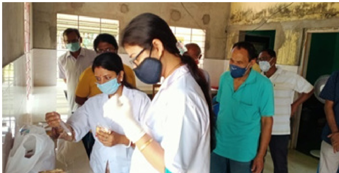
Training of DDD officers and staff at Nagaon laboratory